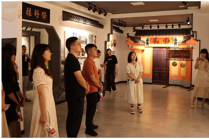
党员干部参观美田桥家风馆。

边际交界处往往错综复杂，沈潭却能享一方安宁，究其原因，与地方文化传承发展，涵养了当地睦邻友爱的淳朴民风密不可分。