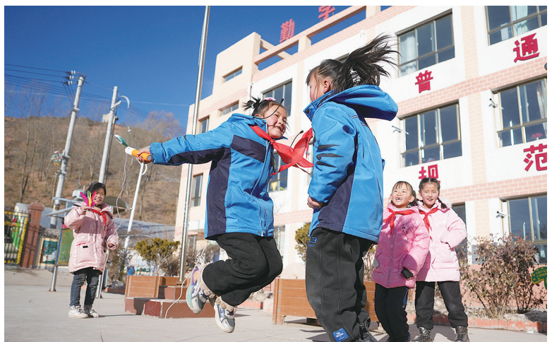
12月25日，积石山县柳沟乡阳山希望小学的学生在课间做游戏。

此外，记者从25日举行的甘肃临夏州积石山6.2级地震新闻发布会获悉，截至12月25日7时，甘肃地震灾区已安装活动板房8096间，安装进程过半。其余正在紧张运输和施工当中。