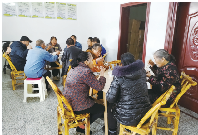
荷塘区樟霞村建起长者餐厅,70岁以上老人可免费午餐。

吃过午饭后,樟霞村的老人还能在村老年人日间照料中心休息,相约一起打打牌、下下棋,或者几人围坐在一起,唠唠家常。