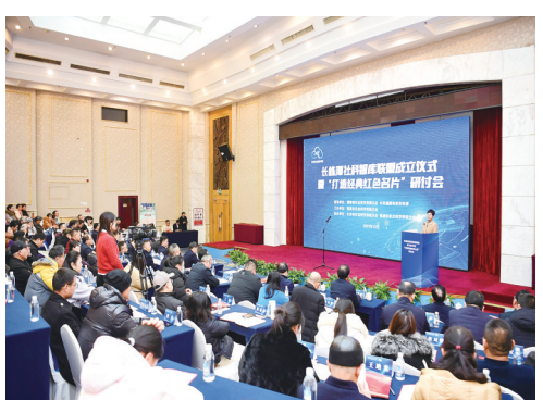
“智汇湘江”长株潭社科智库联盟成立仪式暨“打造经典红色名片”研讨会举行。

当天,长株潭社科联第二次联席会议举行,三市社科联主要负责人分别介绍第一次联席会议以来相关工作情况及近期工作设想。会议通过了《“智汇湘江”长株潭社科智库联盟湘潭宣言》,并确定长株潭社科联第三次联席会议在株洲举办。