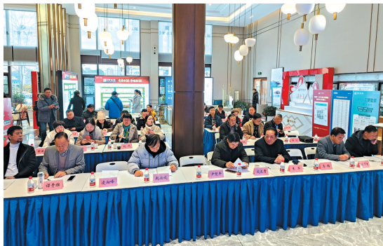
▲座谈会现场。

此次活动主题为“携手谋发展·合作筑未来”,活动就目前株洲市食品、餐饮行业现状进行了探讨分析,面对目前食品、餐饮行业的发展趋势以及面临的困境和问题,强调了行业协会履责和赋能的重要性,加强了各个行业之间的合作与发展,进一步提升了