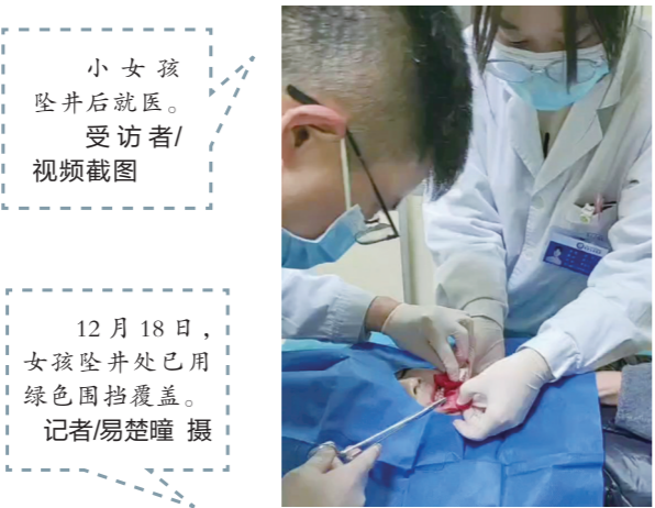
小女孩坠井后就医。