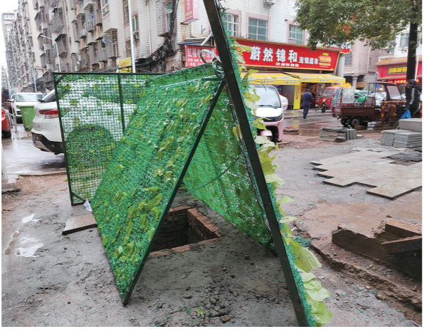
12月18日，女孩坠井处已用绿色围挡覆盖。