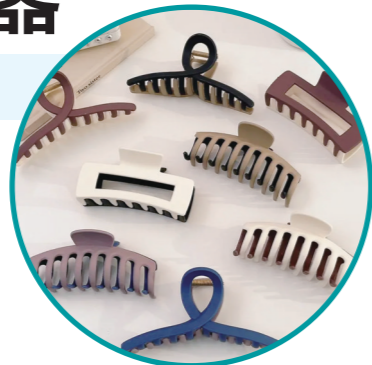
鲨鱼夹，外形很像鲨鱼。

作为一种发饰，“鲨鱼夹”近几年备受消费者青睐。它时髦美观，操作方便，是许多女性消费者购买过的商品。近年来，“鲨鱼夹”伤人事件频发，株洲市场上“鲨鱼夹”销量如何？消费者又对其持何种态度呢？