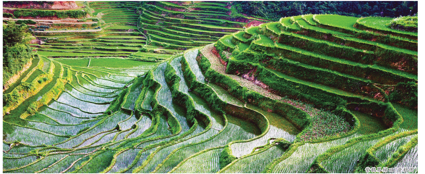
黎锦界梯田(黄村图)