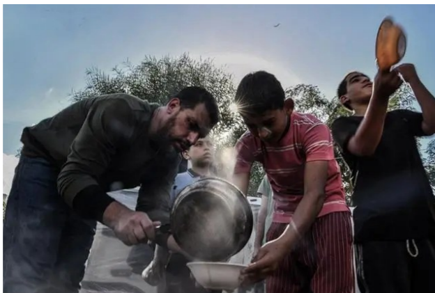
加沙难民饮水困难。