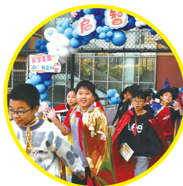
学生们化身“魔法师”参与活动。