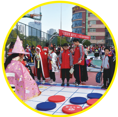
学生们参与数学节点游戏。

本报讯(株洲晚报融媒体中心记者/谭筱) 巫师袍、魔法棒、身穿黄金分割魔法袍的“哈利·波特”……12月8日,天元区建宁小学校园里充满了魔幻色彩,该校开展了以“以数启智·寓学于乐”为主题的第四届数学节点活动。