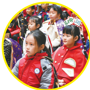
天元区建宁实验小学第四届数学节点启动仪式。 记者/谭筱 摄