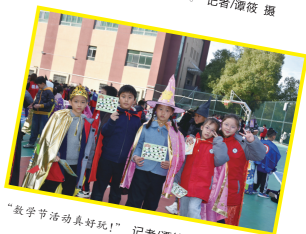
“数学节点活动真好玩!”