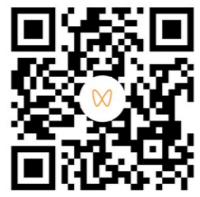
▲打开微信扫码观看视频

走进文艺巷，就像走进一座“城堡”，历史的、现代的、文化的、艺术的、时髦的、有趣的、新奇的……它都囊括其中。有谁会拒绝有美食还可以拍美照打卡的地方呢？今天，文旅推荐官就带大家看看文艺巷有哪些好出片的打卡点！