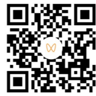
▲打开微信扫码观看视频

12月8日至10日，2023中国国际轨道交通和装备制造产业博览会在株洲国际会展中心举行。小伙伴们零距离感受“大国重器”参与各种打卡活动时，株洲公安的“蜀黍们”巡逻安保、服务群众为博览会筑牢安全防护墙。