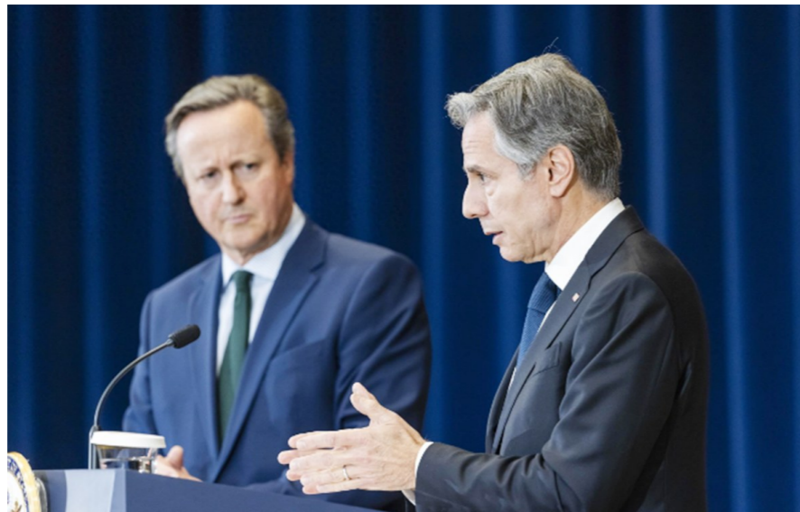
布林肯(右)与美国外相卡梅伦7日出席发布会。

新一轮巴以冲突已持续超两个月，随着加沙地带伤亡人数不断增加，以色列面临越来越大的国际压力。日前，美国国务卿布林肯上周在访问以色列时，敦促以军“在一个月内”结束军事行动。