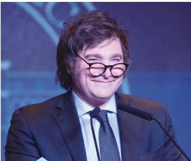
阿根廷新总统哈维尔·米莱。