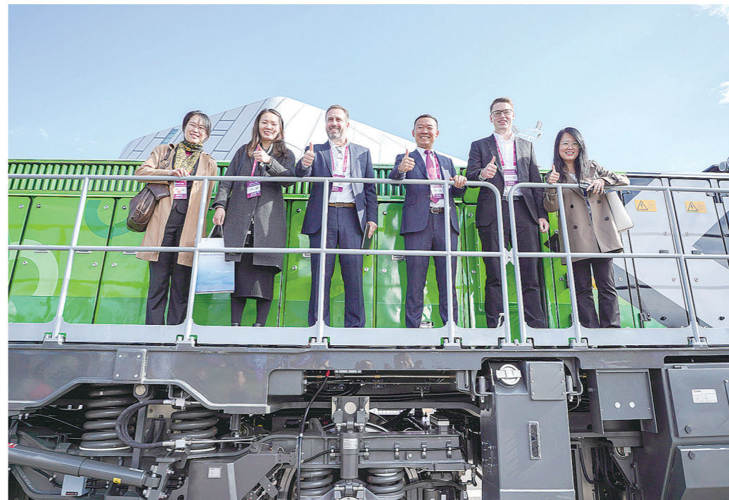
外国客商为中国产轨道装备点赞。