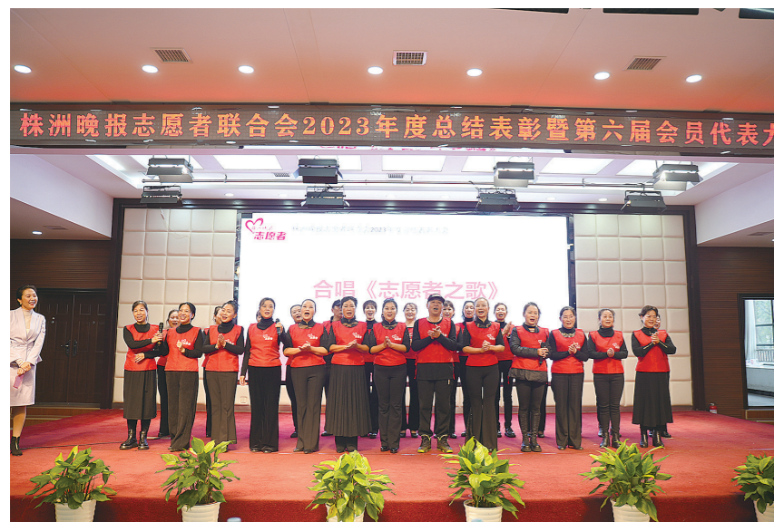
现场合唱《志愿者之歌》。