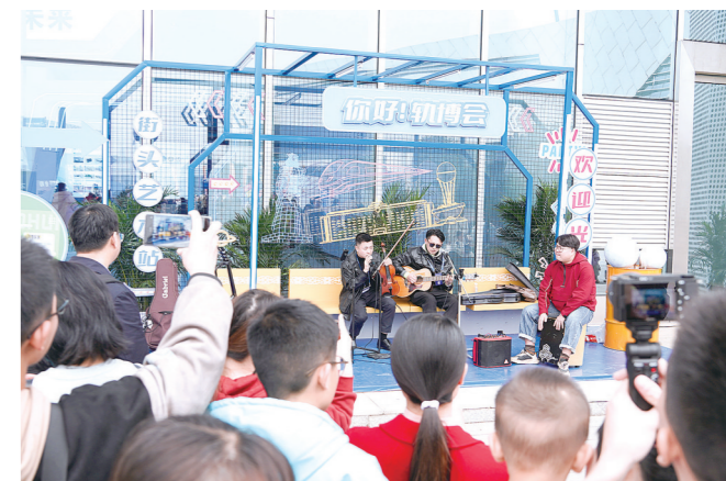
街头艺术站让人眼前一亮。