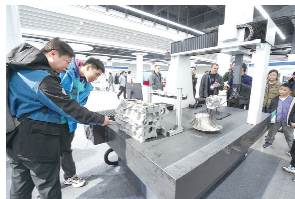
认真观察研究的市民。