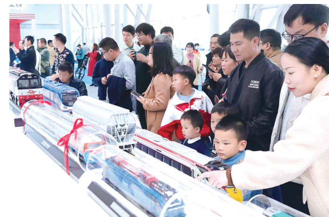
市民参观各类轨道交通及先进机械装备产品。