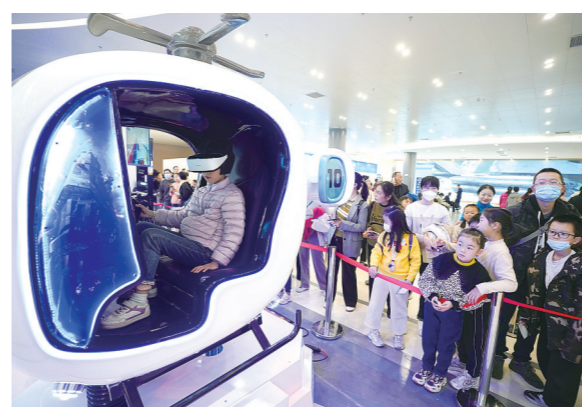
市民在体验数字VR设备。

这是一场新视野、新体验交织的盛会。数万群众涌入展会现场,观摩、体验轨道交通带来的无穷魅力。许多家长带着孩子前来观看,一颗颗关于工业、制造、创新的种子从此在小小少年的心中种下,为中国发展为科技强国打下坚实基础。