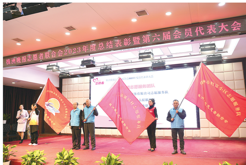
新加盟志愿服务队授旗。

有这样一支队伍,18年来他们活跃在城市的每个角落,不计回报,用自己的行动传递爱、播种爱。如果有人问起:“你们是谁?”他们会淡然一笑:“我们是株洲晚报志愿者联合会志愿者。”