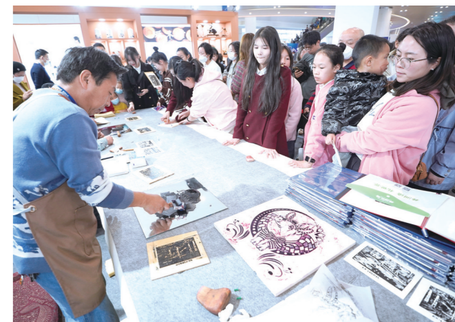
各类文创产品吸引了不少市民打卡、购买和体验。