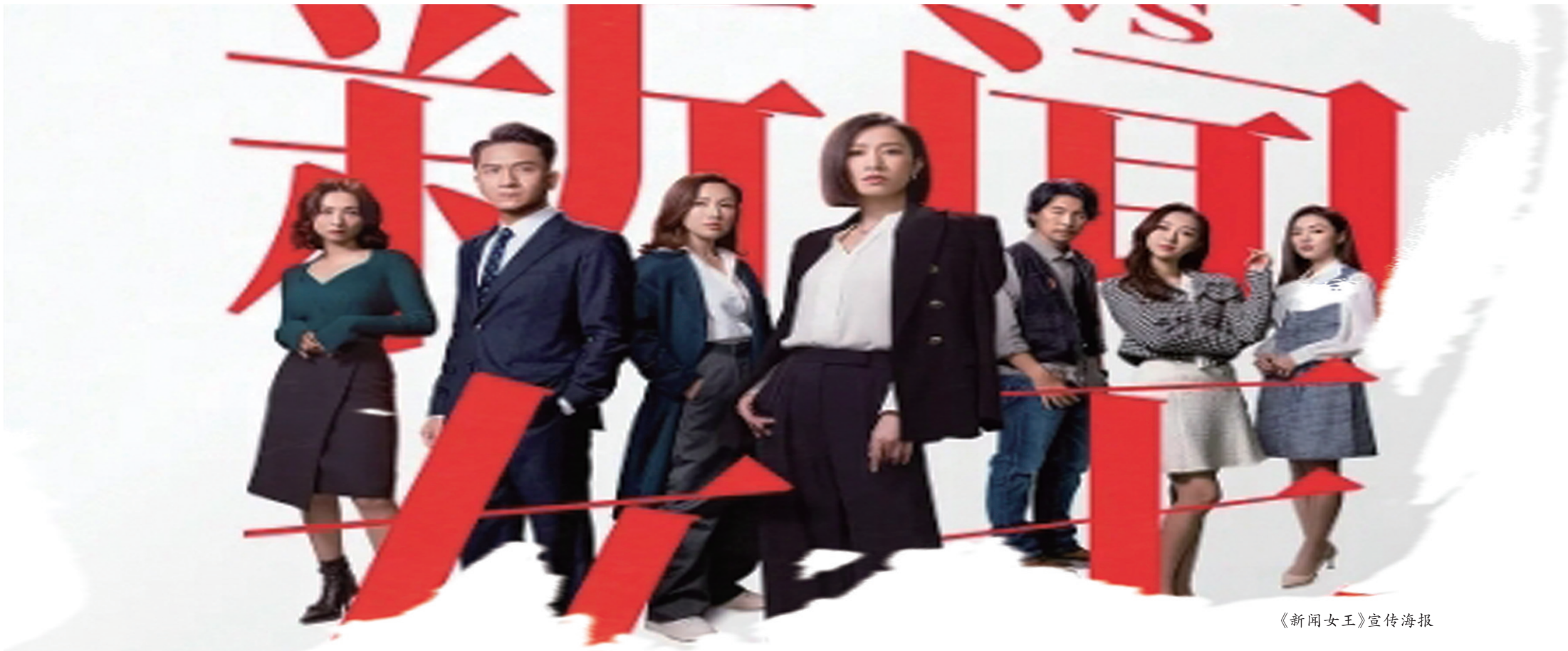
《新闻女王》宣传海报