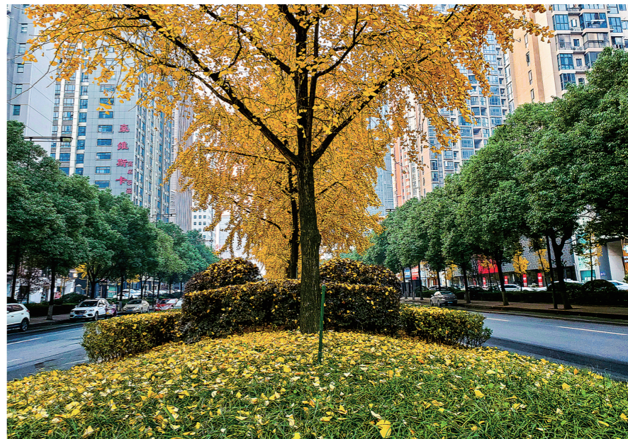
庐山路金黄的银杏,历来都是株洲一景。