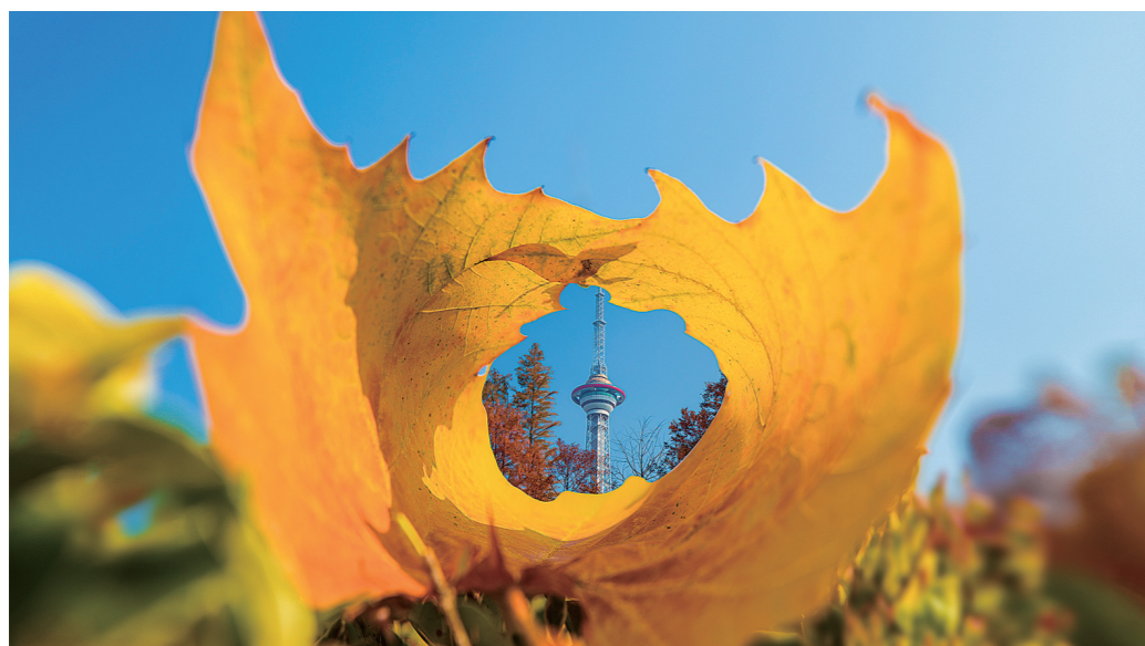
掉落的梧桐叶自然卷曲,为神农塔围框。