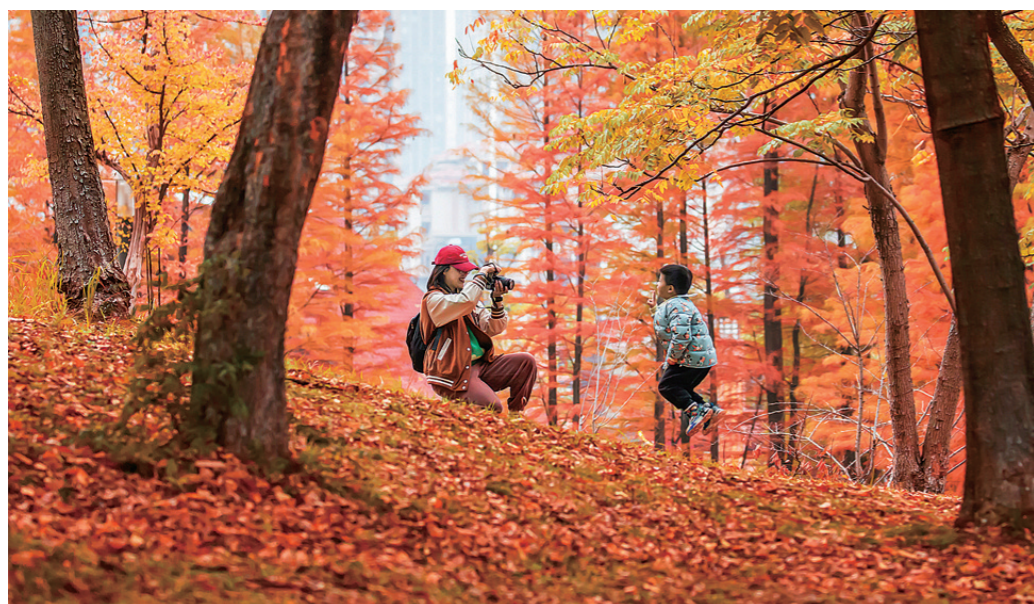
神农湖旁的小山上,漫山都是落叶。