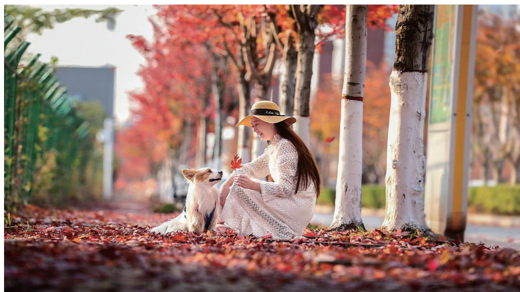
神农大道掉落的红枫叶,铺就了一层红“地毯”。欧阳华 摄