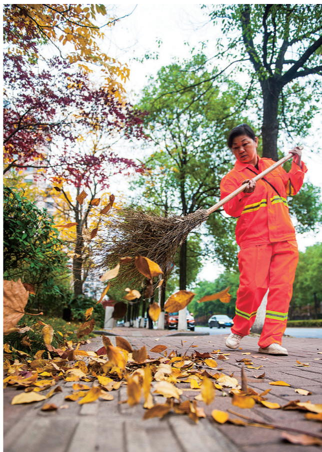
珠江路上,环卫工人正在清扫落叶。