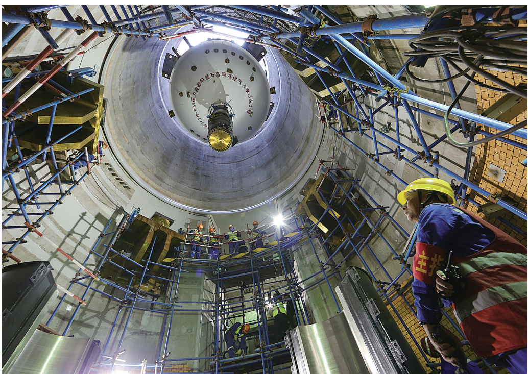
华能石岛湾高温气冷堆示范工程首台反应堆压力容器吊装就位(2016年3月20日报)。新华社发

据新华社北京12月6日电 记者6日从国家能源局和中国华能获悉，华能石岛湾高温气冷堆核电站完成168小时连续运行考验，正式投入商业运行。这是我国具有完全自主知识产权的国家重大科技专项标志性成果，也是全球首座第四代核电站，标志着我国在第四代核电技术领域达到世界领先水平。