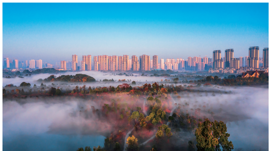
【蓝】江边晨雾中的湘水湾。