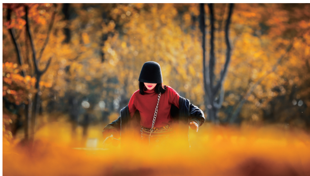
【橙】神农城的一位红衣丽人。