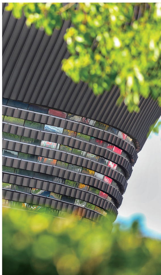
【绿】绿树环绕的株洲博物馆。