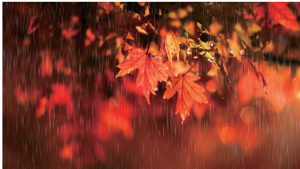
【红】夜雨中的神农大道枫叶。