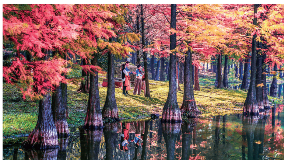
【紫】栗雨湖边的水杉。