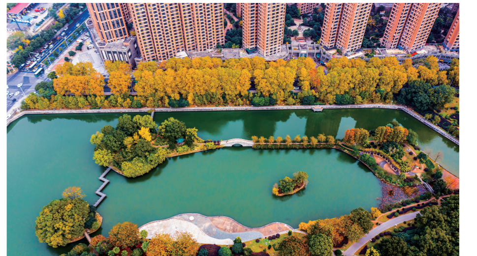
【青】文化园和人民路的梧桐。

譬如,上班或回家途中的一街一景,还有我们和这座城,我们和这个冬天,出其不意的缘分。然后的然后,你会期待,接下来,是更黄的银杏、更红的枫叶、更蓝的天空,和,更好的我们。