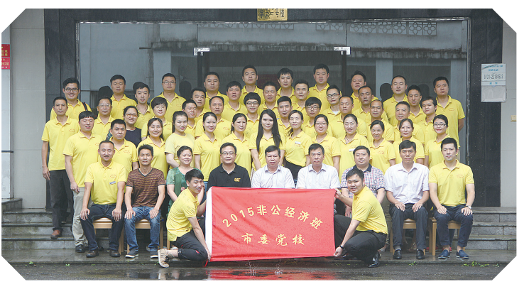
2015年市委党校非公经济班

开展“国企带民企、大手牵小手”活动。2022年,株洲市工商联共组织国企与民企对接活动9次,促使本地采购金额超过20亿元。深挖大型央企资源,我市一大批民营企业与国有企业建立了产业链共建、科研共创等系列合作模式,助推我市民营企业加速转型升级,快速融入全球化竞争浪潮。