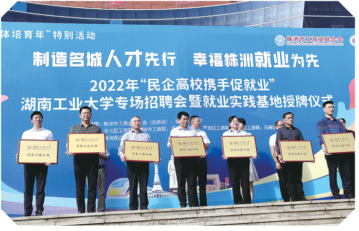
2022年“民企高校携手促就业”专场招聘会