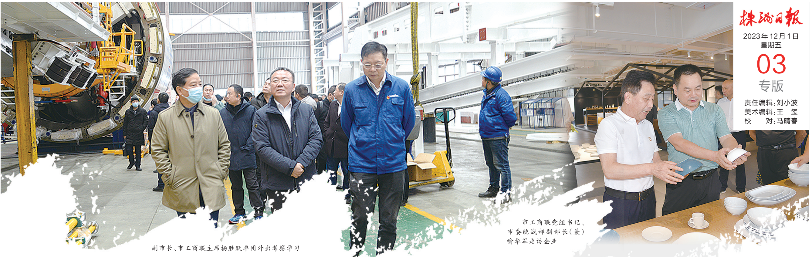
副市长、市工商联主席杨跃群率团外出考察学习