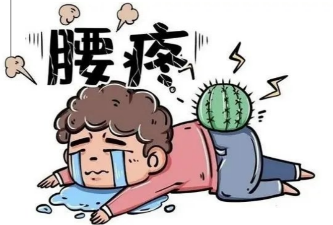
有些人腰痛严重,只能这样趴睡。