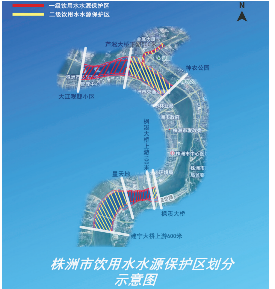
株洲市饮用水水源保护区划分示意图。

“简单来说,湘江城区段有防护网(栏)的区域,就是饮用水水源一级保护区。”该负责人说,在饮用水水源一级保护区内游泳、垂钓或从事其他可能污染水体活动的个人,将被处500元以下罚款。