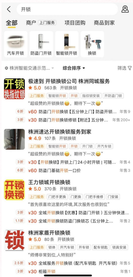
某平台上提供的开锁服务。记者 谢嘉供图

日前，中消协发布《2023年第三季度全国消协组织受理投诉情况分析》提示，数字化时代，消费者越来越依赖网络渠道获取售后服务信息，相关品牌方和家电维修平台应当及时适应这种变化，在官方网站等渠道对零部件费用和上门维修服务费价格进行公示，方便消费者查询，保障消费者知情权。消费者在选择家电维修公司时，也要多方查证，注意从其客服电话、公司名称等方面甄别是否为官方售后。