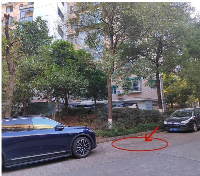
刘先生车辆在小区的停放位置。

日前，家住天元区天台小区的刘先生致电 12345 热线，称自己疑似掉入骗子的圈套。