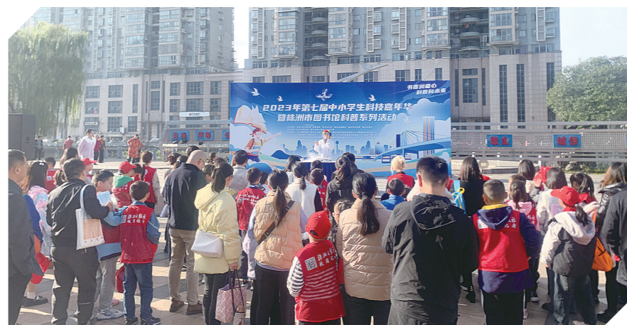
第七届中小学生科技嘉年华暨市图书馆科普活动启动仪式现场。