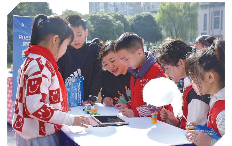
“小小发明家”为学生介绍自己科技作品。记者/谭筱 摄