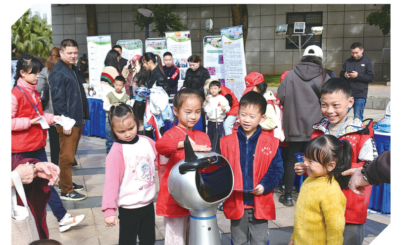
“哇，机器人好好玩了！”