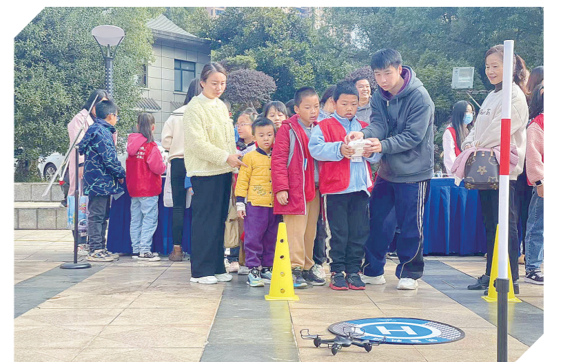
学生近距离操作无人机。

据介绍，此次活动由株洲市文化旅游广电体育局、株洲市科协、株洲市教育局、株洲市科技局、株洲日报社主办、株洲市图书馆、株洲日报社校园记者俱乐部承办。