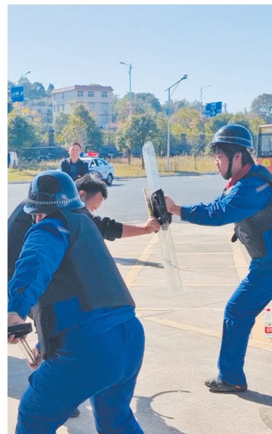
图为演练现场。

11月21日，一名“歹徒”与加油站工作人员发生冲突，持刀欲砍杀工作人员。加油站立即启动应急响应，第一时间报警的同时，工作人员穿戴好防护装备，齐心协力将“歹徒”制服。——这是公交物资公司在金山公交基地开展技术大比武暨反恐防暴演练。