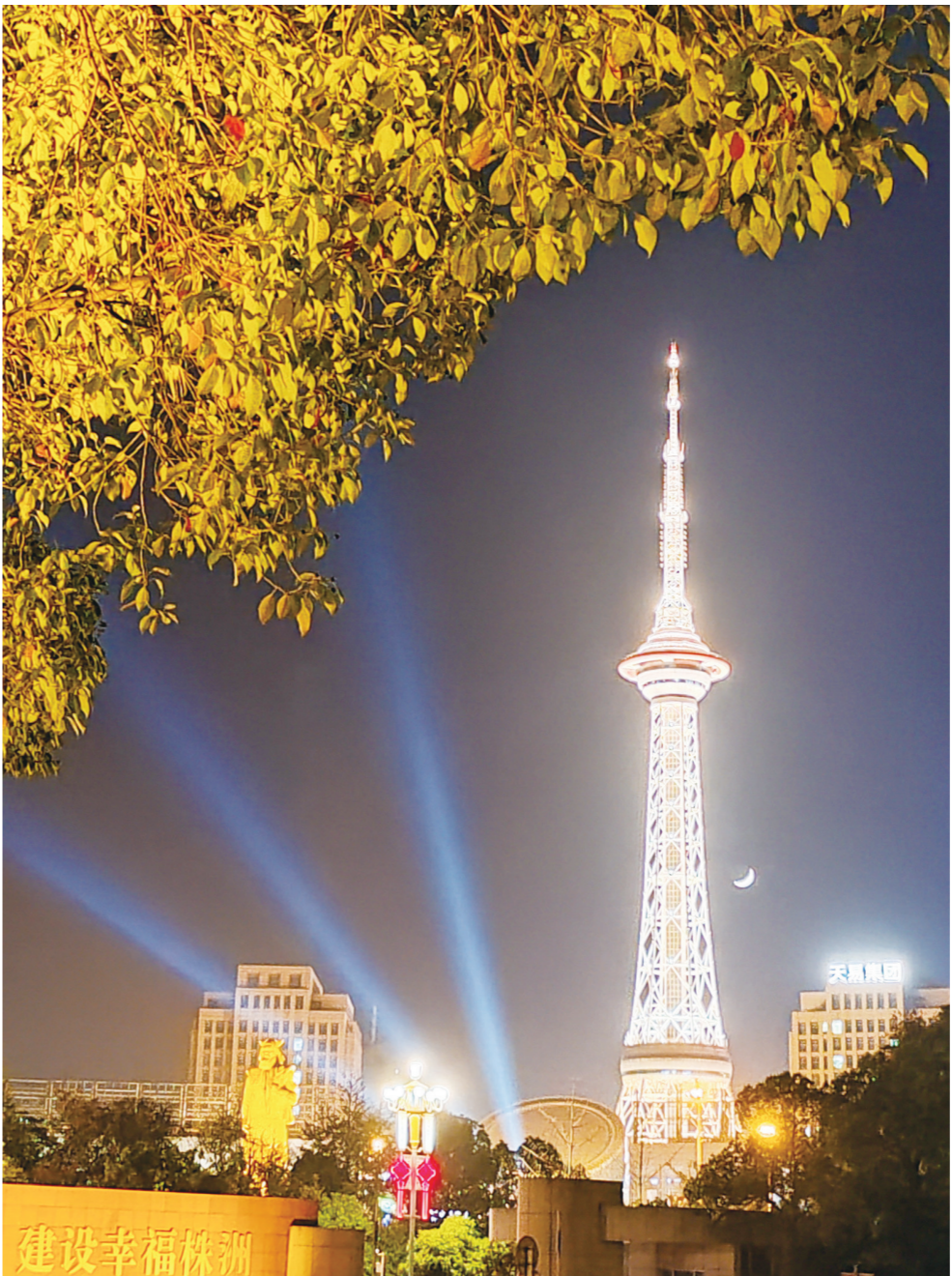
11月19日晚,天元区神农广场,神农塔和月牙相映生辉。