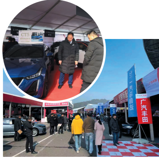
▲往届车展现场。

随着2023株洲冬季汽车博览会的日益临近,各大汽车品牌和消费者都已做好准备,共同迎接这场