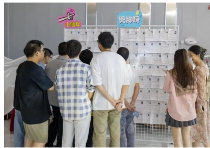
株洲晚报红娘活动现场。资料图

如果你决定参加相亲,只需要做好心理准备,并且坚持自己的原则和信念,就能够找到真正的爱情。