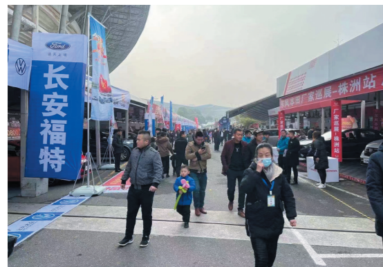
▲往届车展现场。

据悉,本届株洲冬季车展将汇聚30个汽车品牌,为消费者呈现一场精彩纷呈的车市盛宴。各大品牌