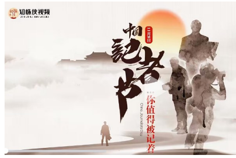
▲第二十四届记者节。