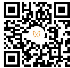
文字、图片、视频/知株侠