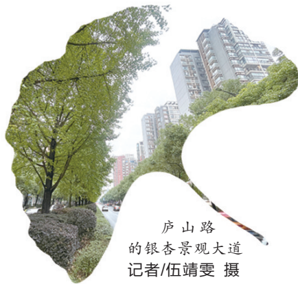
庐山路 的银杏景观大道