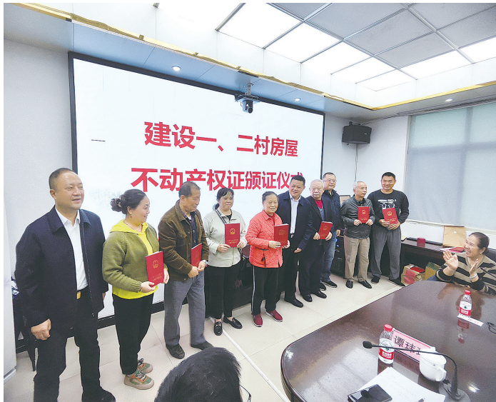
居民们拿到了苦等多年的不动产证,喜笑颜开。

信访工作一头连着党心,一头连着民心。近年来,芦淞区坚持把人民群众当家人、把群众诉求当家事,多管齐下解决群众“急难愁盼”问题。该区畅通和规范群众诉求表达、利益协调、权益保障渠道,切实维护群众利益。