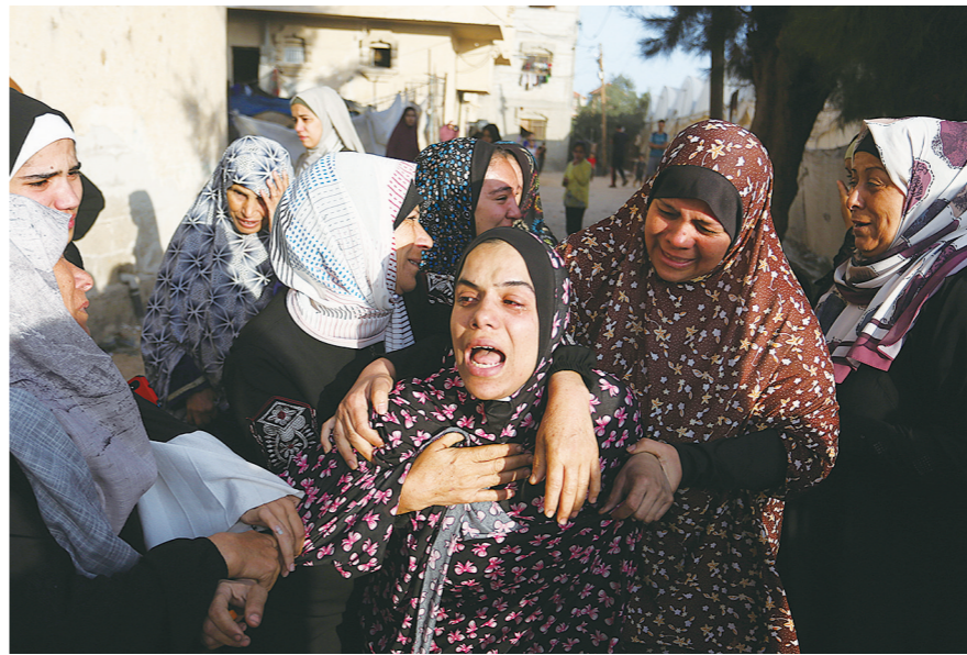
11月11日,在加沙地带南部城市拉法,人们悼念在冲突中遇难的亲人。

据中新网11月11日电 综合外媒报道,新一轮巴以冲突自当地时间10月7日爆发以来,已过去一个多月。截至目前,巴以双方的死亡人数已超1.2万人。 当地时间11月10日,法国总统马克龙呼吁以色列停止轰炸加沙,随后被以总理内塔尼亚胡拒绝;同日,世卫组织总干事谭德塞表示,目前加沙地带每10分钟就有1名儿童被杀。