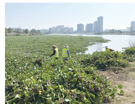
打捞人员在明照湖中的水葫芦进行打捞清理。

“上游不进行打捞清理,还会有水葫芦往下游去。”一名居住在河边的住户呼吁,对明照湖上游方向河道内的水葫芦也同步进行打捞清理。