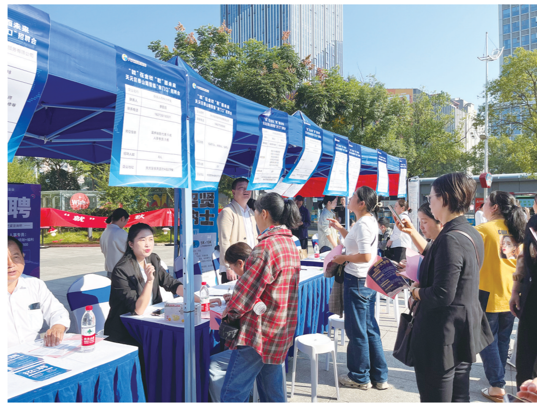
11月2日,天元区泰山路街道举办“‘就’在金秋,‘职’面未来”专场招聘会,30余家企业提供近400个岗位,帮助居民实现“家门口”就业。