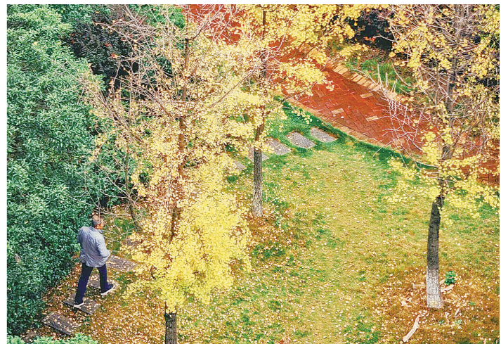
近日,天元区建设农园的银杏叶黄了,飘落大地。