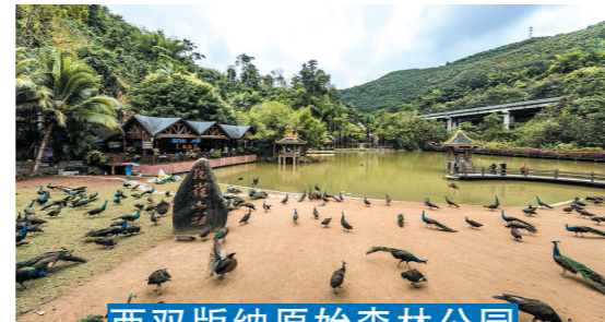
西双版纳原始森林公园