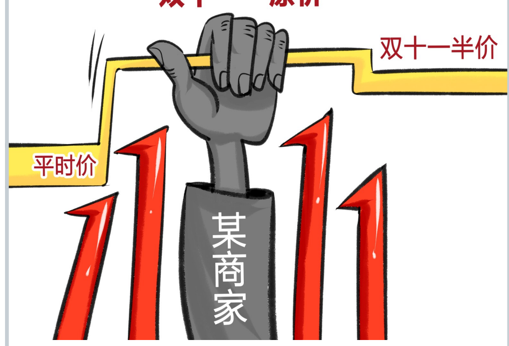
明降暗升。 漫画/左骏