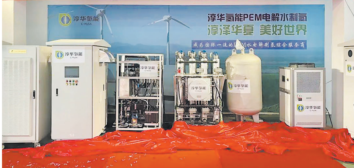
淳华氢能科技(湖南)有限公司首台套PEM制氢储能应用综合系统设备亮相。