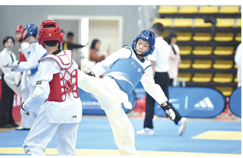
跆拳道选手在比赛场上展现飒爽英姿。

本次比赛由省体育局、省教育厅联合主办,全省校园跆拳道比赛是推进我省学校“五育并举”,促进体教融合的一项重要举措,为校园跆拳道运动的发展注入新的动力,为我省发现和培养更多的优秀跆拳道后备人才。