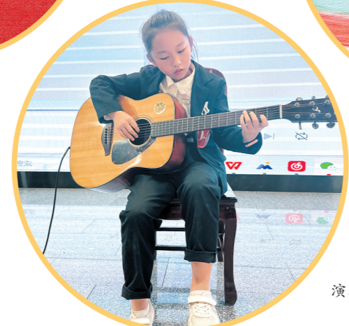
▲参赛选手吉他演奏展才艺。