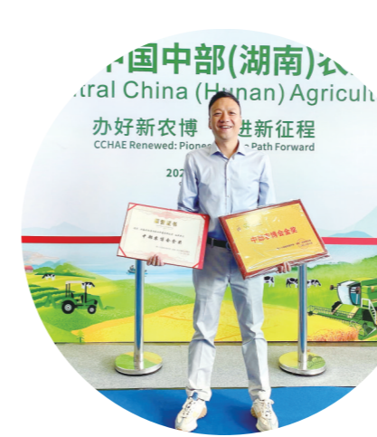
白关丝瓜荣获“中部农博会金奖”。

本报讯(株洲晚报融媒体记者/杨凌凌 通讯员/罗金鹏) 10月31日,第二十四届中国中部(湖南)农业博览会在长沙顺利闭幕,从会场传来捷报,芦淞区组织参展的白关丝瓜、苗妹子豆豆羹脱颖而出,双双斩获博览会金奖。由此,芦淞区金奖数量排名株洲市城区第一、全市第二,为其参加农博会以来的历史最好成绩。