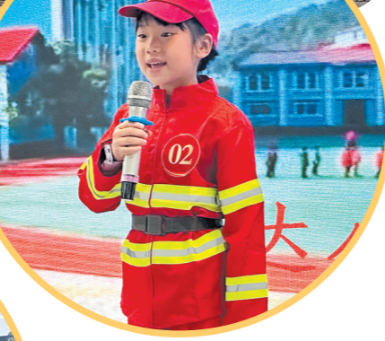
▲校园记者才艺展示环节。