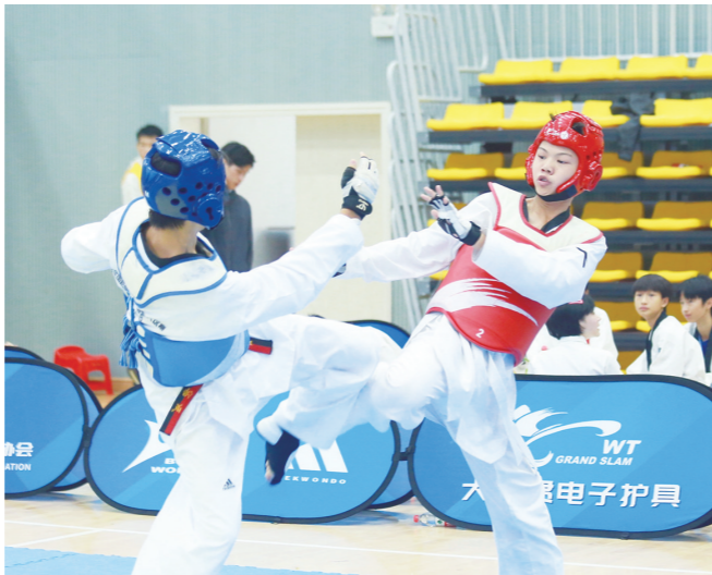
株洲小选手在全省校园跆拳道比赛上展现飒爽英姿。

在为期3天的比赛中,株洲市五中的小选手们以昂扬的斗志、坚定的信念,顽强果敢、迅猛敏捷的招式力压群雄,获得初中组团体总分和竞技团体总分第一名,该校还和芦淞区南方第一小学获评赛事道德风尚奖,石峰区先锋小学获得综合展演一等奖。