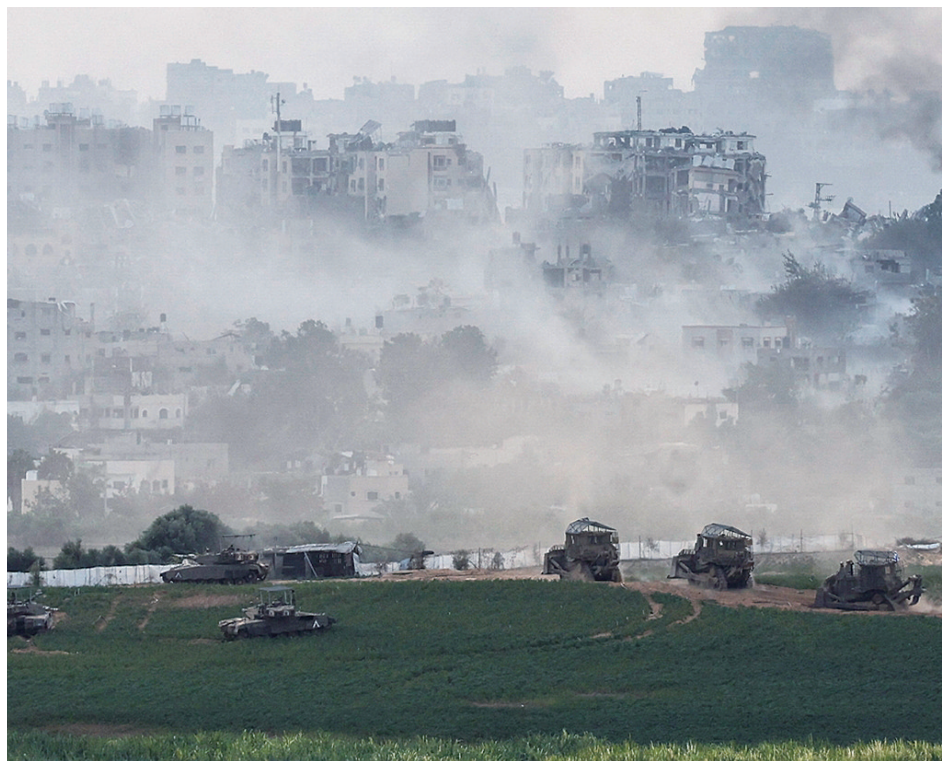
10月29日,以军坦克和推土机进入加沙地带活动,以色列方向视角。