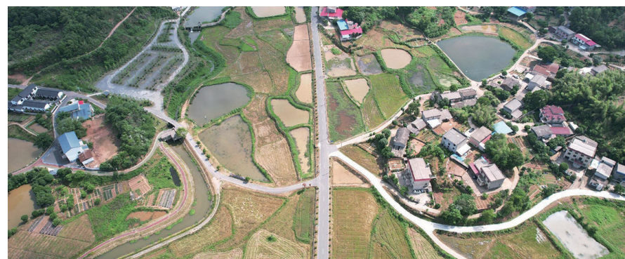
茅太新村俯瞰图。

道路、农村厕所革命等基础设施改造,到生活污水、生活垃圾、环境卫生治理等重要工作推进,再到文化、旅游、产业等项目打造,株洲坚定不移地走生态优先、绿色发展的高质量发展新路子,推动城乡经济社会发展全面向绿色转型。一幅壮美的城乡画卷,装进了390万株洲人民的幸福生活。