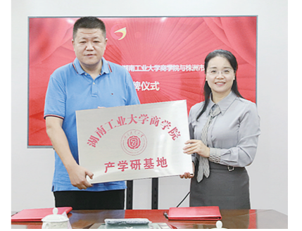
授牌仪式现场。

本次合作将共同致力于人才培养、产业发展,在科学研究、学科建设、成果应用和学术交流等方面互惠共进,为实现资源共享、优势互补打下坚实基础,持续推进区域人才发展、转型,提升培训与人才储备能力。