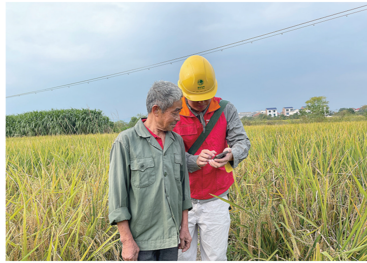
供电公司工作人员和农户讲解村网共建平台用电申请流程。