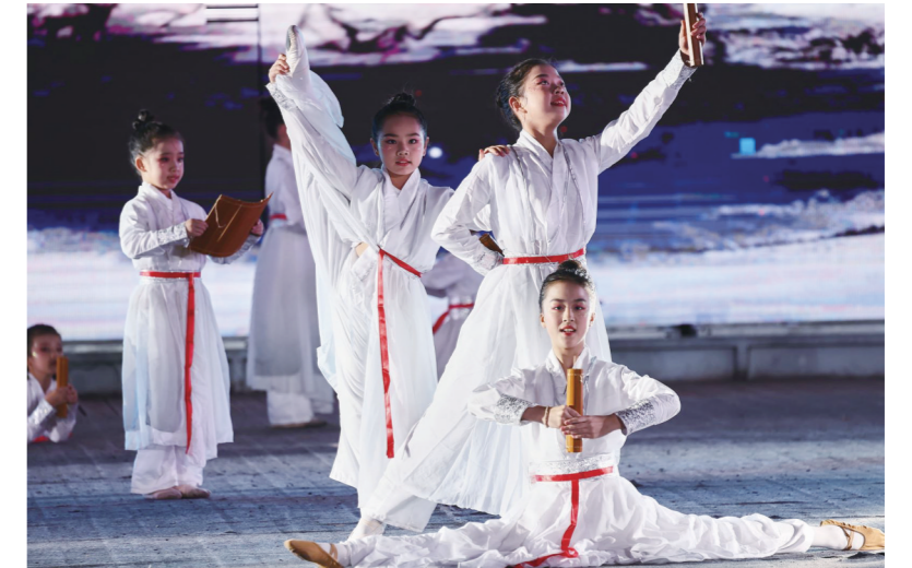
舞蹈节目《壮志少年行》演出现场。