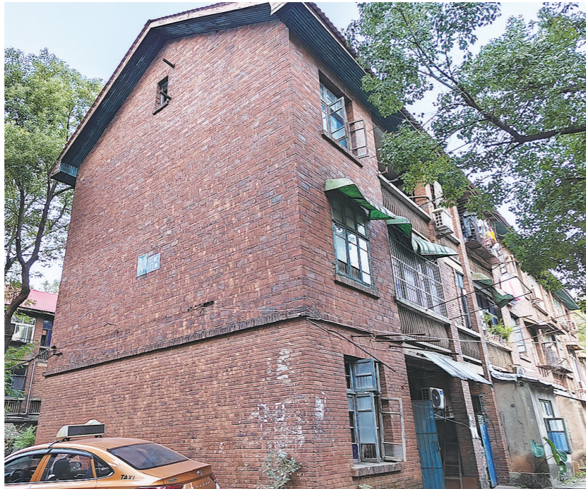
石峰区杉化生活区“横七竖八”的各色线头也被改造成“横平竖直”。