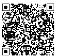
图片/中车株机 文字、视频/央视网