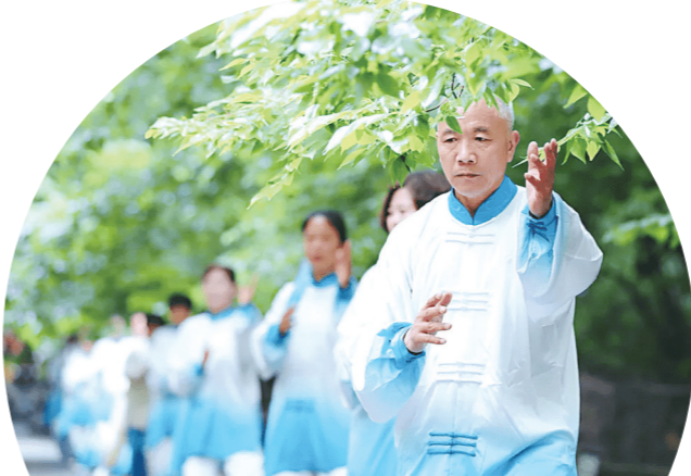
老年人运动要适度,避免剧烈运动和过度运动。