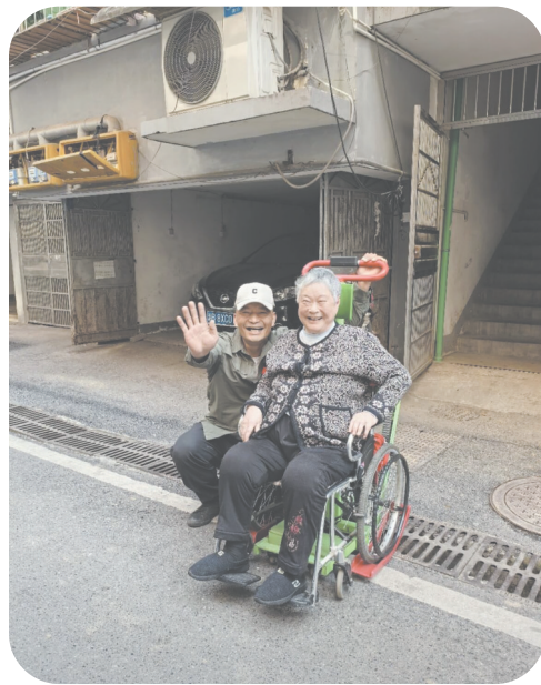
爱心爬楼机帮助老人安全下楼。