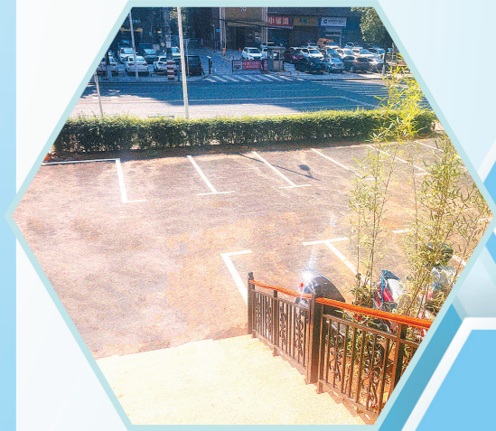
百江花园小区附近,“荒地”改造的便民停车场。

记者从市城管局获悉,今年以来,我市重点围绕老旧小区、学校、医院等停车矛盾突出区域,充分摸排利用空坪隙地,建设临时泊位。尤其是针对“寸土寸金”的中心商圈等区域,今年以来已增加640个停车泊位,有效缓解“停车难”问题。