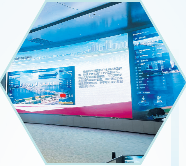
我市通过在株洲大桥上设置的123个监测点进行数据采集,实现桥梁运行情况动态监测。

具体怎么说?最近,记者走进株洲城市综合管理服务平台指挥室,近距离了解数字赋能带来的城市管理新变化。