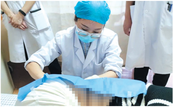
▲管床医生为患者进行鞘内注射。

本报讯(株洲晚报融媒体中心通讯员/黄刘 刘超群)这天，37岁的康女士(化名)把株洲市中心医院神经内二科医护人员邀请到病床旁，原来她悄悄订了一个蛋糕，想和大家一起分享，感谢医护人员陪她度过这段特殊时光。她说医生护士的温暖和细致，让她很感动，她想记录自己顺利完成首次鞘内注射治疗的喜悦，也为了庆祝即将到来的生日。