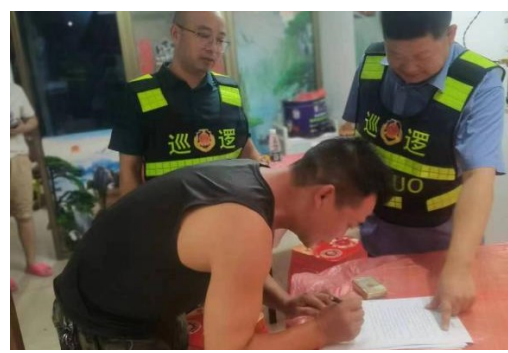
平安巡逻队队员与辖区商户签订打非治违的安全承诺书。

网格员们坚持以解决城市基层治理中存在的问题、困难及群众需求为导向，紧盯四个重点，即重点场所、重点区域、重点人群、重点部件，主动发现日常治理中容易忽略的“盲点”“难点”