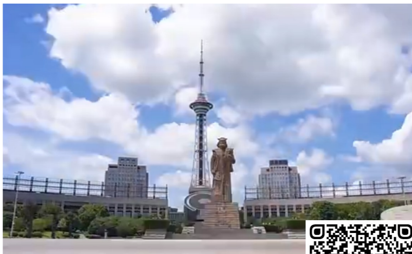
株洲城区及各区县的美景。