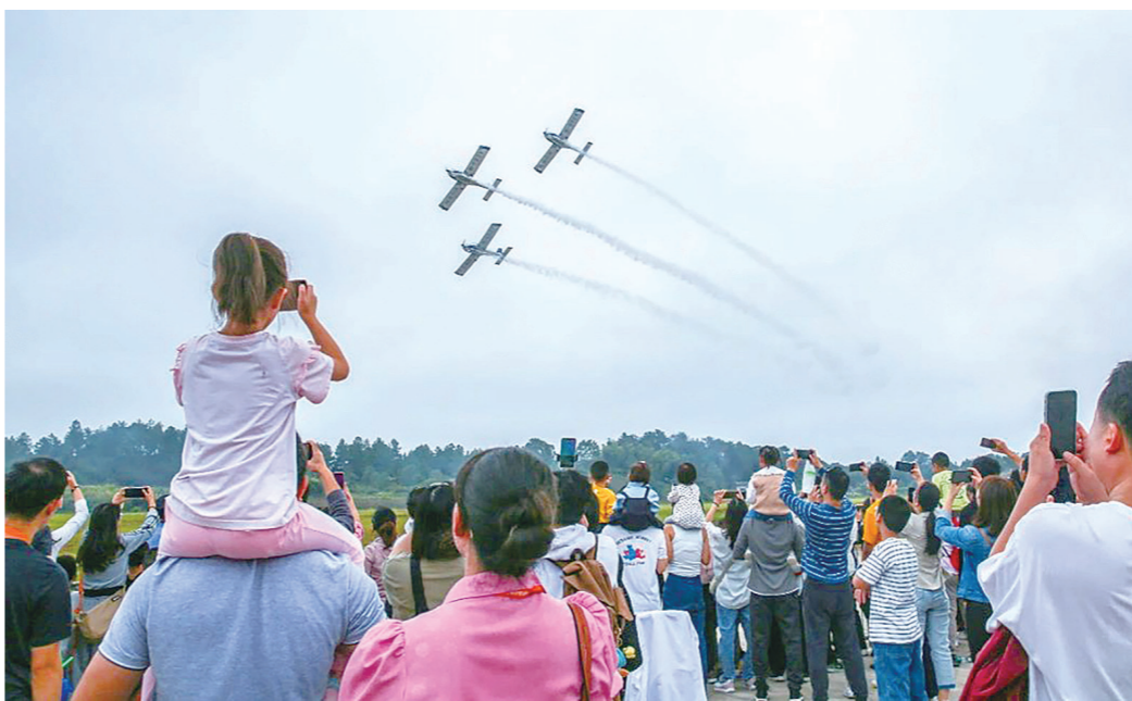
游客和市民在观看飞行表演。

10月4日,央视《第一时间》报道:这个黄金周,湖南株洲吸引了不少来自全国各地的游客,乘坐轻型运动飞机,体验特技飞行。