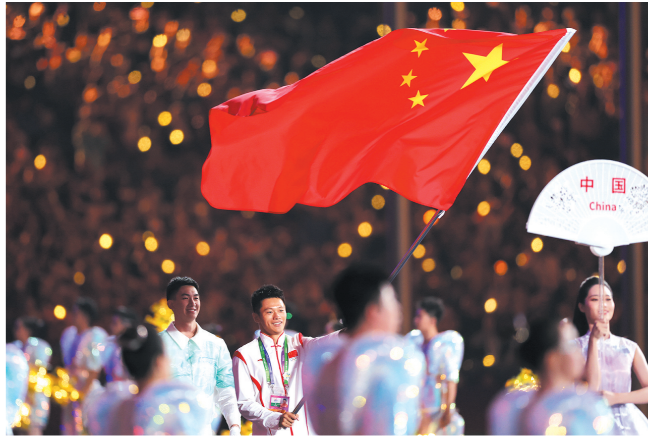
10月8日，中国体育代表团旗手谢震业在闭幕式上入场。当晚，杭州亚运会闭幕式在杭州奥体中心体育场举行。图据新华社

本报讯(株洲晚报融媒体中心记者/温琳 通讯员/周谭清 仇明) 10月8日，是第19届杭州亚运会最后一个比赛日，经过15天的角逐，中国军团以201金111银71铜的成绩单，位列金牌榜、奖牌榜双榜首。株洲相关运动员收获多枚金牌。