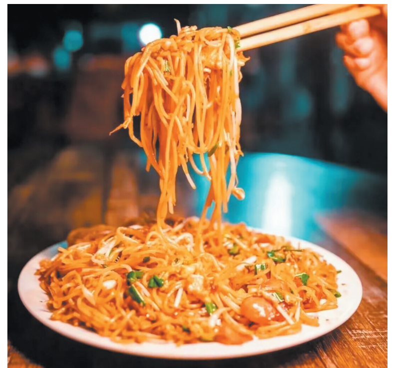
醴陵炒粉。