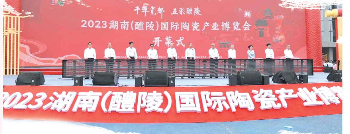
▲开幕式现场。

本次瓷博会以“千年瓷都 五彩醴陵”为主题,展会时间为10月28日至10月2日。本届瓷博会本着“隆重、安全、创新、实效”的原则,突出智慧制造、科技创新、开放包容,将展会蝶变成集陶瓷精品展示、陶瓷文化交流、陶瓷产品交易于一体的国际化陶瓷专业博览会,迎全球宾客,共赏陶瓷烟花,共谋产业发展。