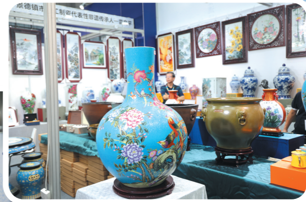
▲精美的瓷器目不暇接。谭俊杰 摄

值得注意的是,“国瓷之光”醴陵釉下五彩精品展,汇聚了多位重量级陶瓷艺术大师的代表力作,集中展现醴陵釉下彩最高工艺水平,吸引不少游客眼光。