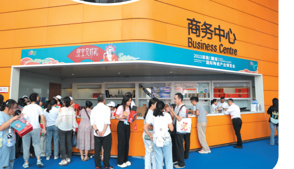
▲领取寻宝图鉴的游客排起了长队。谭俊杰 摄