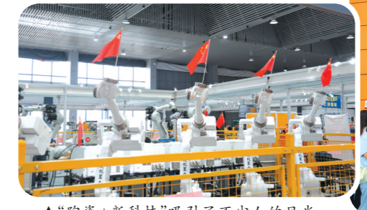
▲“陶瓷+新科技”吸引了不少人的目光。

据悉,2023湖南(醴陵)国际陶瓷产业博览会将持续到10月2日,更有露天音乐会等众多节目陆续上演,双节期间不远游,大家赶紧去瓷博会展馆,正式开启一场“逛、玩、买”的惬意游玩之旅吧。