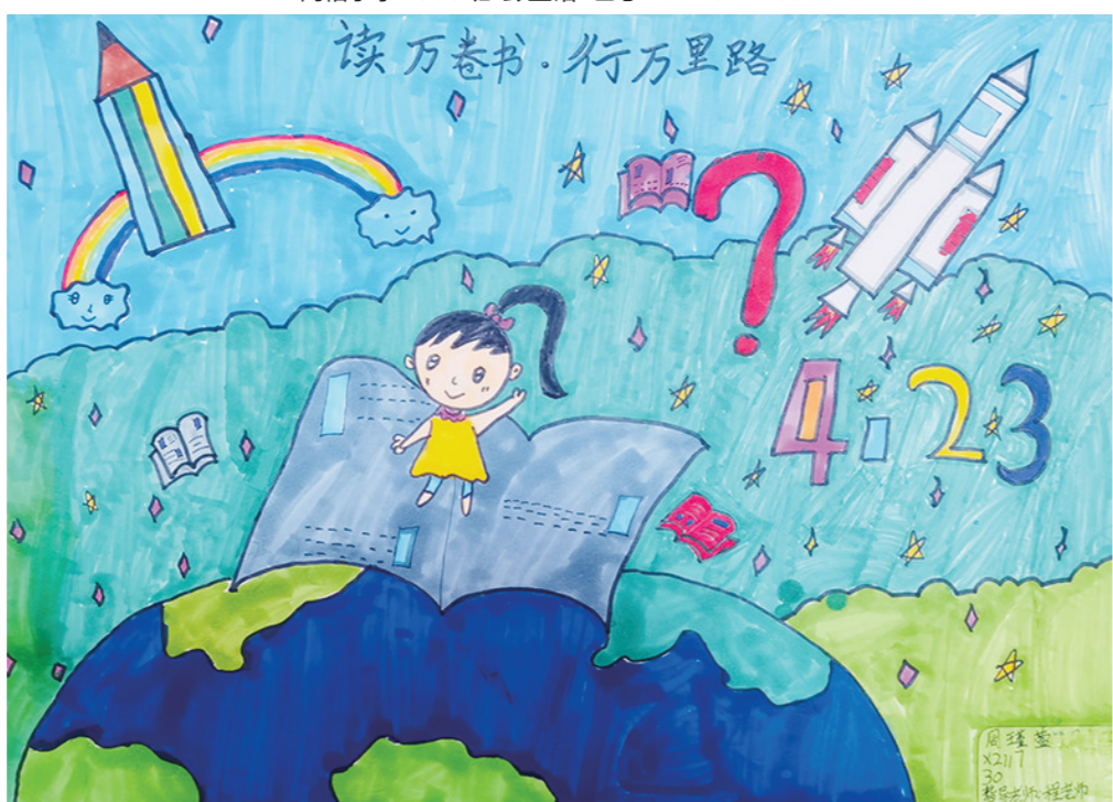
读万卷书,行万里路