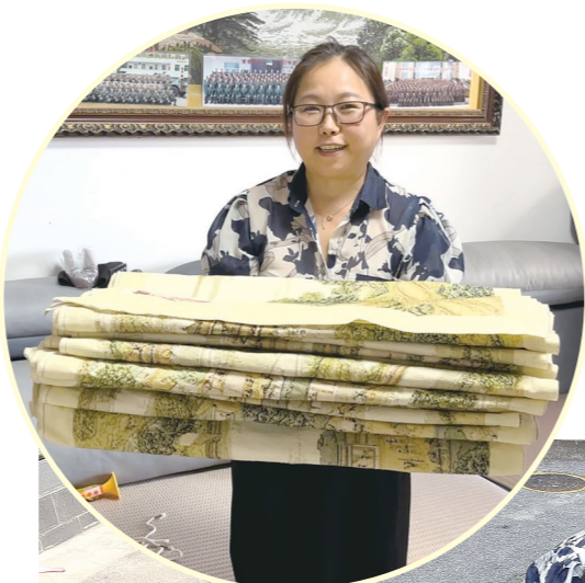
22米长的十字绣作品叠起来放在家中。

她表示,如果有活动或展会需要展示一些展品,她非常乐意提供自己的《清明上河图》十字绣作品,通过展出供市民观赏。同时,她也希望这幅作品能被收藏。