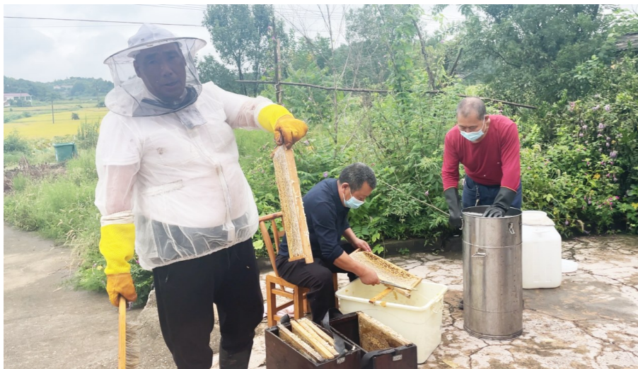
建龙村养蜂人正在取蜜。

本报讯(株洲晚报融媒体记者/杨如 实习生/吴求芳 通讯员/杨灼焯 文钦)俗话说,靠山吃山,靠海吃海。在天元区雷打石镇建龙村,有一群忙碌的养蜂人,他们利用家乡自然环境优势,用勤劳的双手与蜂共舞,酿造“甜蜜生活”。