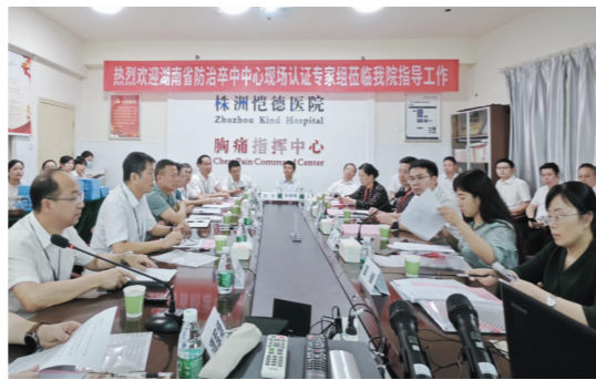
▲恺德防治卒中中心接受专家组评估认证现场。

反馈会上,专家组成员分别就各自现场核查情况进行了反馈。湖南省卫健委医政医管处一级