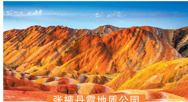
张掖丹霞地质公园

张掖世界地质公园位于甘肃省张掖市，拥有包括裕固族在内的众多少数民族和577处文化景点。张掖世界地质公园是国内唯一的丹霞地貌与彩色丘陵景观复合区，是一座集科学研究、科普教育、旅游观光、历史文化、民族风情、地质遗迹保护于一体的大型地质公园。张掖丹霞地貌分布广阔、场面壮观、造型奇特、色彩艳丽是我国干旱地区最典型和面积最大的丹霞地貌景观，具有很高的科考价值和旅游观赏价值。张掖丹霞地貌被誉为“张掖窗棂状宫殿式丹霞地貌中国第一”，“张掖彩色丘陵中国第一，世界10大神奇地理奇观”之一。享有“中国彩虹山”美誉。