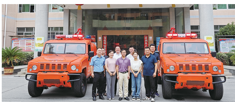
渌口区林业局森林消防车交车仪式现场。

下阶段,渌口区将结合全省森林防火基础设施建设“两年行动”,持续完善林火阻隔网建设,加大巡护宣传演练培训力度,全面构建“人防、物防、技防”三防模式,为人民群众生命财产和森林资源安全保驾护航。