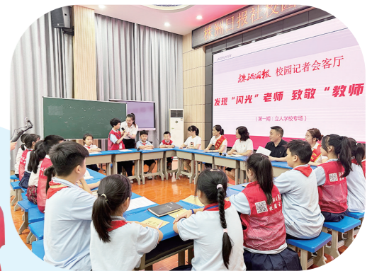
株洲日报社校园记者会客厅“发现‘闪光’老师 致敬教师节”主题活动走进芦淞区五星学校。