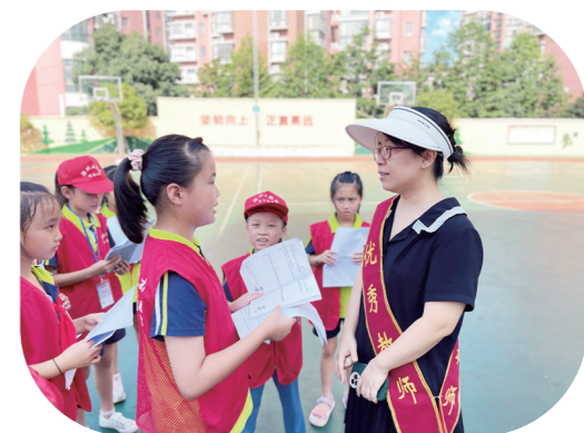
杉木塘小学庆祝第39个教师节表彰活动后，校园记者采访获奖的优秀教师。

“老师像园丁，给学生修剪枝叶，老师像蜡烛，燃烧自己点亮别人。”“老师，您辛苦了！祝您教师节快乐，桃李满天下！”“老师，对于我们来说，您不止是一位良师，更是一位益友。教师节到了，衷心祝您节日快乐！”“您用幽默演绎出课堂的欢乐，您用博学谱写出语文的优美，您用睿智勾勒出我们人生的蓝图。”……校园记者们纷纷向老师表达节日的祝福，感谢老师对自己的关心与爱护，感谢老师辛勤的付出。