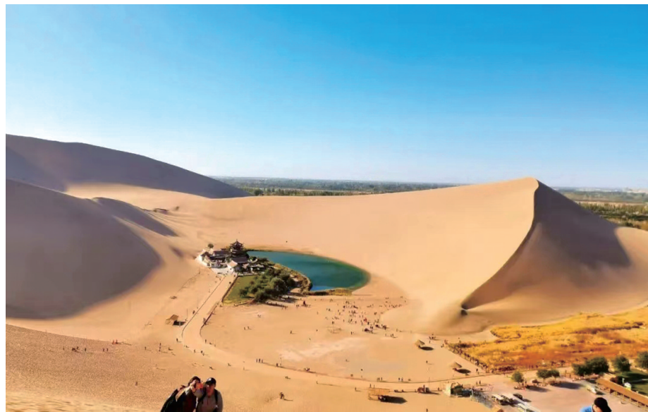
▲鸣沙山月牙泉。

报名时间:即日起报名(今年最后一趟,位置有限,先报先得) 咨询报名:153-8748-8787(小陈);153-6733-9799(小李) 报名地址:株洲市神农公园大门口(温馨夕阳旅游)