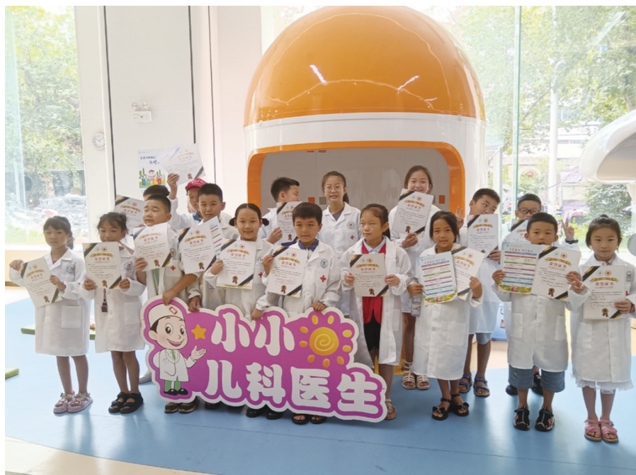
校园记者变身“小小儿科医生”。

“为丰富孩子们的暑假生活,培养他们的生活技能,感受生活的乐趣,提高动手能力。”株洲日报社校园记者俱乐部相关负责人说,通过一系列的手工活动,孩子们不仅增长了新技能,更重要的是体验到了动手实践的乐趣,提高了他们的观察能力、想象力和创造力。