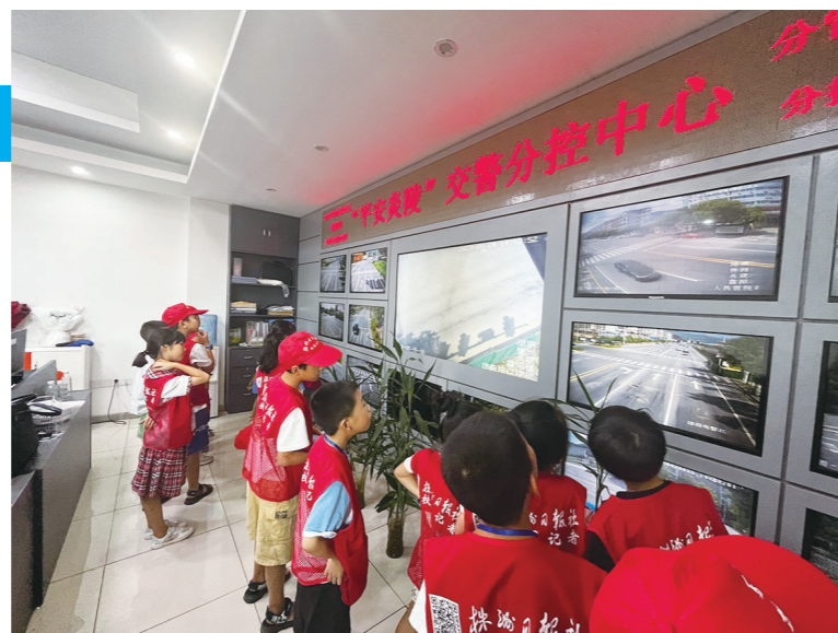
校园记者走进炎陵县交警大队。

一次深度游体验,孩子们用脚步丈量城市,用手触摸历史,增长了见识,收获了友谊,更打开了对文化、科技、艺术等兴趣大门的钥匙。他们与同龄人一起身临其境,与历史互动,与历史对话,共赴了一场历史之约。