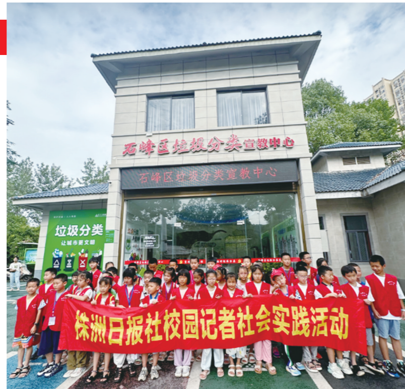
暑期社会实践之社区学院实践教学,校园记者探秘石峰区垃圾分类宣教中心。

据了解,株洲日报社校园记者俱乐部每年寒暑假都将举办职业生活体验活动,旨在让校园记者深入不同的职业岗位,感知社会生活,品尝酸甜苦辣。让孩子们在劳动中真正收获喜悦和成长历练,培养正确的职业观和价值观,为健康成长增添正能量。