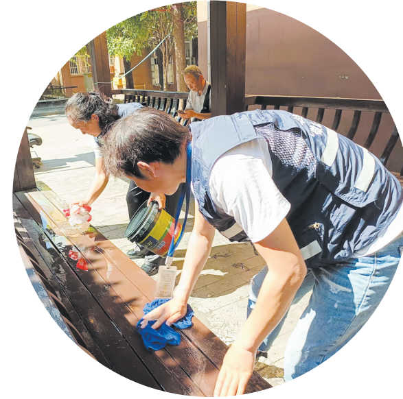
信息采集员在井塘社区工作时顺手清洁廊亭座椅。

前日,市城管监督指挥中心发布1至7月“数字城管”运行大数据,一起来看看,这张“数据网”如何让城市管理越来越精细科学。