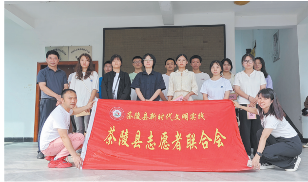
助学金发放现场。

据了解,茶陵县志愿者联合会成立于2009年4月,由社会爱心人士自发筹备组建,是志愿为社会提供无偿服务的社会各界人士组成的社会团体。13年来,组织志愿者开展各项志愿服务活动2300余次,总服务时间18万多小时,累计筹集企业和个人爱心捐款800余万元。