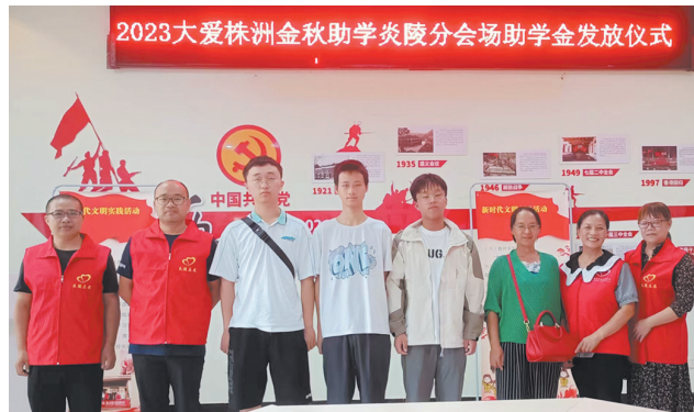
助学金发放现场。

炎陵县鱼片志愿者联合会相关负责人介绍,今年金秋助学开始后,他们受株洲日报社金秋助学承办单位株洲晚报志愿者联合会委托,对此次拟助学子一一进行了走访,“我们希望此次助学活动,能给困难学子带去希望和力量,让他们感受到社会大家庭的关爱与温暖,激励他们树立远大理想抱负,常怀感恩之心,牢记家乡山水之情,在大学里认真学习,顽强拼搏,学到真本领,回报家乡,成就自我。”