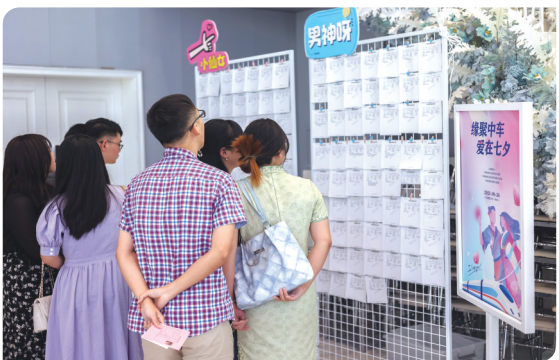
▲嘉宾们查看异性资料。

株洲日报讯(通讯员赵闻博) 制造名城，幸福株洲。缘聚中车，爱在七夕。近日，为助力单身青年员工解决婚恋问题，激发工作热情，为企业高质量发展留住人才，中车株洲集团、中车株洲所团委、中车株洲电机团委联合举办了“缘聚中车，爱在七夕”主题联谊活动。本次活动是近年来中车系规模最大、范围最广的联谊交友活动，共计120余人参与，现场氛围热闹非凡。